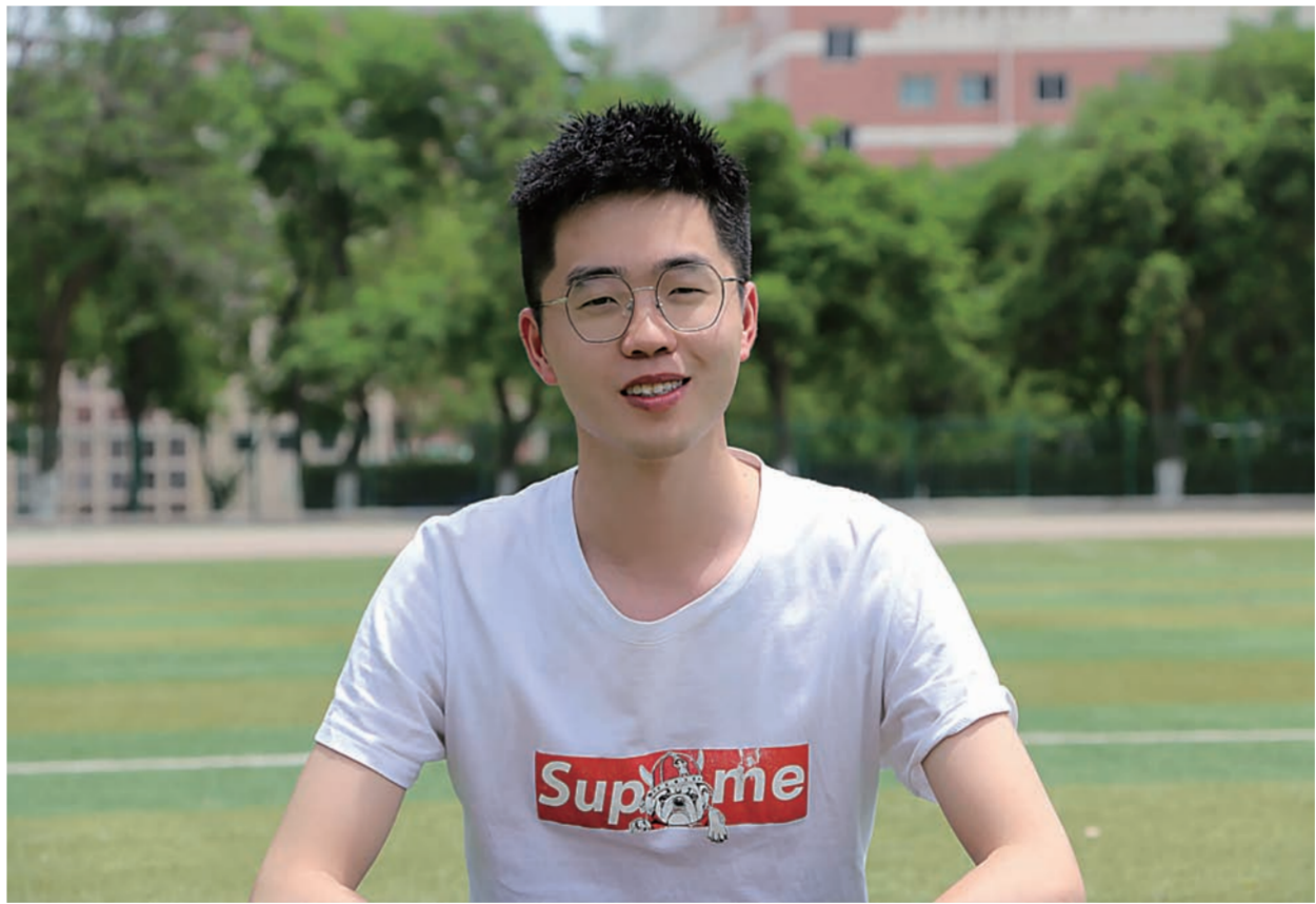
■ 学生记者 郝涛涛 陈子昂 雷晴雁

大学期间,张福超除了参与竞赛之外,还积累了不少实习经验。2020年11月,张福超在成都的西南建筑研究院实习,在实习期间,张福超接触到老旧小区改造等设计方案,以及一些精细化的ppt制作。这些经历都对他的专业有着很大帮助,也正是因为他优异的成绩和丰富的实践经验,在大四下学期就确定了自己保研的道路,尽管也纠结过早放弃考研是不是没有给自己留退路,但是他始终对自己有信心,并努力做好眼前的每一件小事,最后成功的保研了重庆大学的建筑系。张福超常说:“随时保持60分的谦逊,90分的状态,把剩下的10分交给未来。”