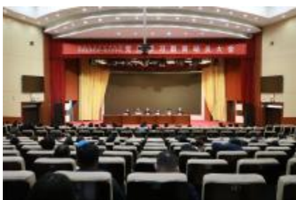
(上接第 1 版)作动员讲话,党委副书记王学武主持大会。