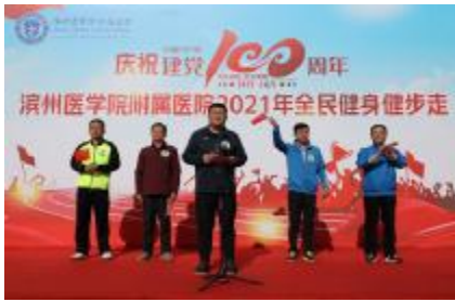
为热烈庆祝中国共产党成立 100 周年,鼓励全院职工积极参加体育锻炼,4

月 17 日上午,滨医附院(第一临床医学院)在美丽的蒲湖湖畔举行 2021 年全民健身健步走暨庆祝建党 100 周年主题活动。医院(学院)医护教职职工、离退休人员及其家属共 2000 余人参加此次活动。