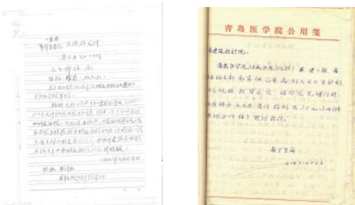
▲ 关于在北镇新建青医附院的批复