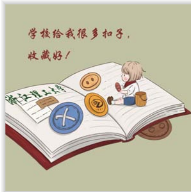
20 美术学(商业插画)2班 金炜