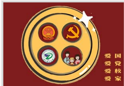
20 中美视觉传达2班 吴梦纤