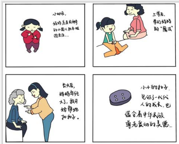
18 中美服设4班 李珂莹

浙江理工大学“扣好人生第一粒扣子”毕业生廉洁教育主题漫画展,是国际教育学院、国际时装技术学院和艺术与设计学院学生以“扣好人生第一粒扣子”为主题进行的漫画创作。学生们发挥艺术类专业特长优势,立足廉洁教育、面向毕业生,以艺术语言寄语毕业生用清风正气扣好“第一粒扣子”,让廉洁从业护航美好人生。此次漫画展,既是始业教育,也是临别赠言,体现了母校的拳拳爱心和美好祝愿。