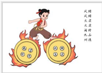
19 中美服设4班 张亦涵