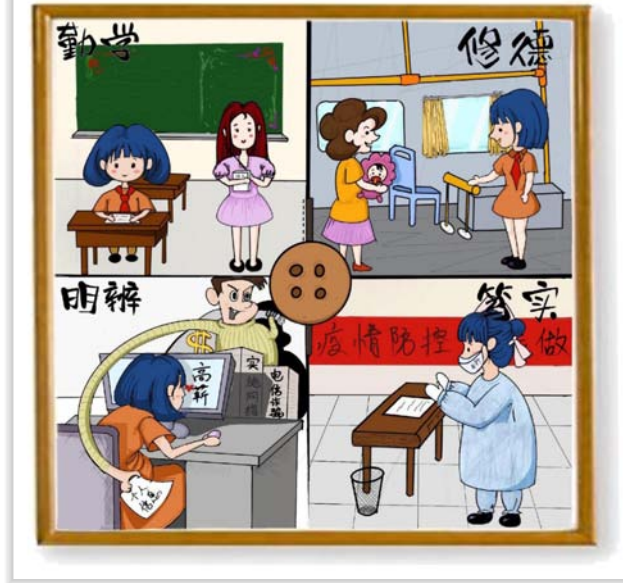
19 中美服设4班 曾芷馨