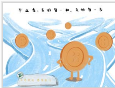
18 工业设计2班 何玉洁