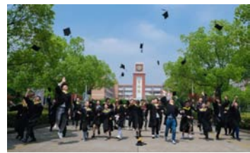
革,带动新业态的诞生。