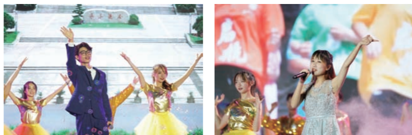
在充满活力的《舞力觉醒》表演中,晚会开启了下篇:远志·勇进者胜。

随着舞台灯光亮起,晚会在《浙中医大欢迎你》的歌声中正式开场。热闹喜庆的氛围、高亢悦耳的歌声,无一不表达着浙中医大对来自全国各地2021级新生的欢迎。