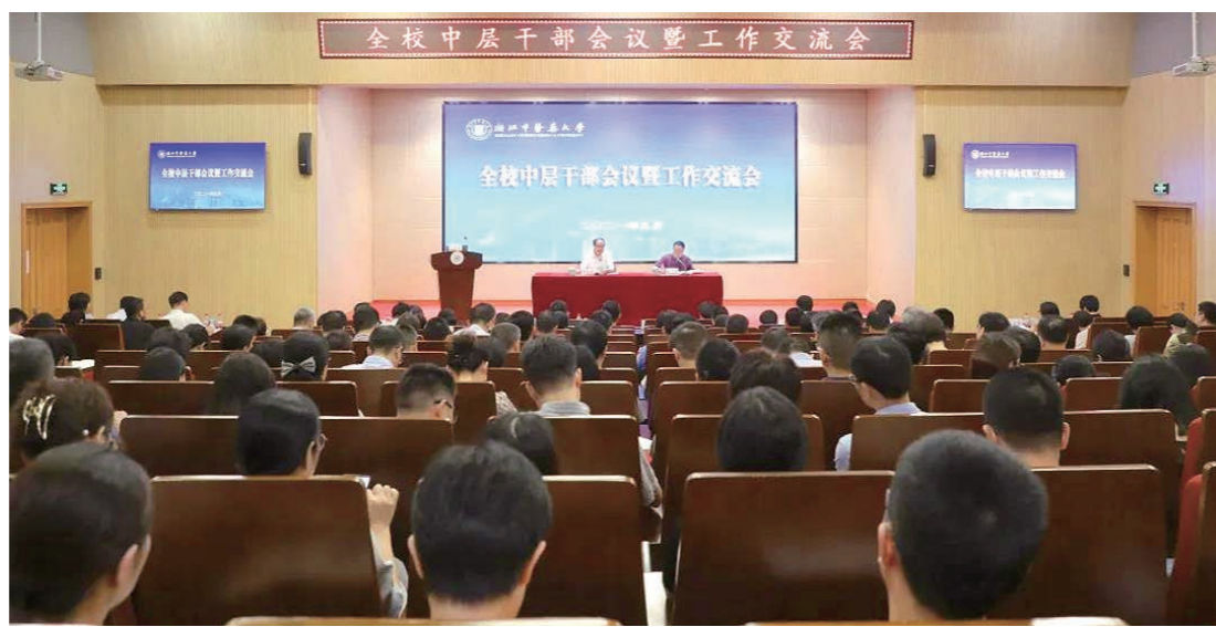
“三全育人”综合改革、重点平台申报与建设、科技项目培育与申报、高水平附属医院建设等相关工作进行了全面部署,并要求各学院、部门(单位)抢抓机遇、主动出击、狠抓落实,高质量推进世界一流中医药大学的各项创建工作。

陈忠围绕登峰学科建设、高层次人才引进、重大科研成果培育、重大教学成果培育、一流专业申报与建设等全局性重点工作,“放管服”改革、数字化改革、