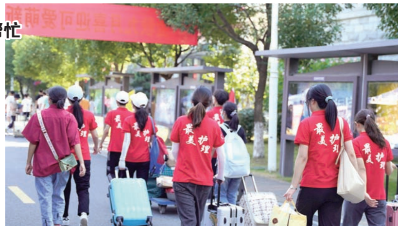
(文:徐巧玲 图:费瑛 余佳怡 卓辰悦 舒麦)