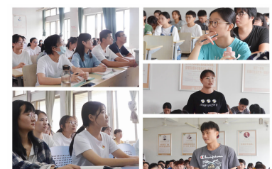
学校学生认真上开学第一课