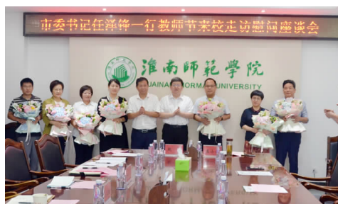
淮南市委书记任泽锋一行来校走访慰问合影留念

本报讯 今年9月10日是第37个教师节,当天上午,中共淮南市委书记任泽锋一行来校走访慰问。市人大常委会主任陈儒江,市委副书记汪谦慎,市委常委、组织部部长马文革,市一级巡视员、市委秘书长胡东辉,市教育体育局局长杨慎红;淮南师范学院党委书记陈年红,校长李琳琦,纪委书记赵辉,副校长陈永红、左小云,办公室、组织部、宣传部、人事处、教务处相关部门负责同志以及教师代表参加了座谈会,会议由李琳琦主持。