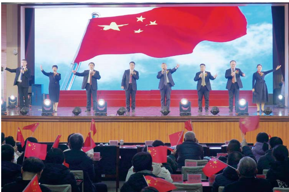
院领导小合唱《团结就是力量》