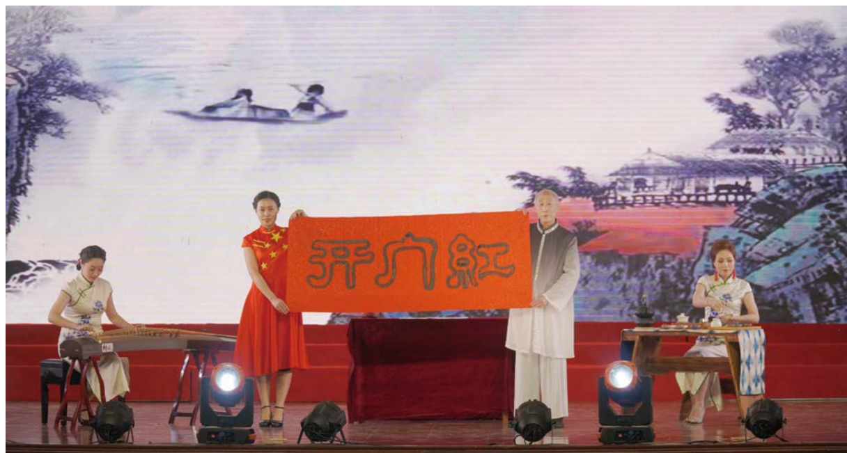
古筝茶艺表演《渔舟唱晚》