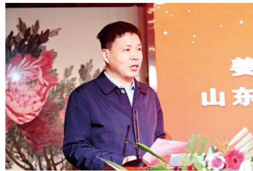
淄博市卫生健康委党组书记、主任，市中医药管理局局长程勤致辞