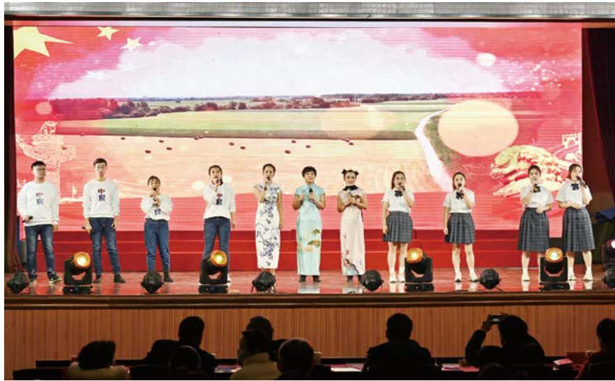
歌曲串烧《明天会更好》