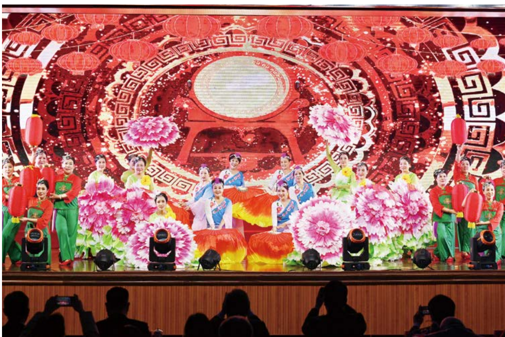
开场舞《盛世欢歌闹新春》