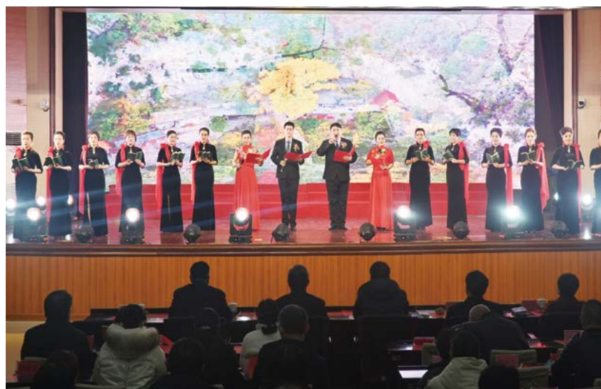
旗袍秀诗朗诵《诗韵旗袍》