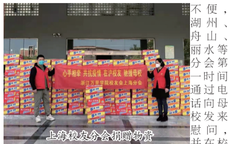
上海校友分会捐赠物资