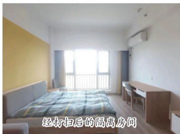
经打扫后的隔离房间