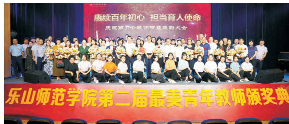
2021年9月10日，我校在实训楼多功能厅举行以“闪亮的名字”为主题的表彰大会，庆祝第37个教师节。图为校领导与获奖教师合影