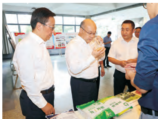
2020年6月16日，时任四川省省委常委、组织部部长王正谱（左二）来校调研指导工作，他详细了解了竹类病虫害防控与资源开发四川省重点实验室杨福君团队的科研成果。