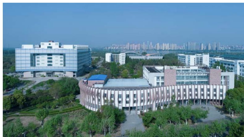
校园一角