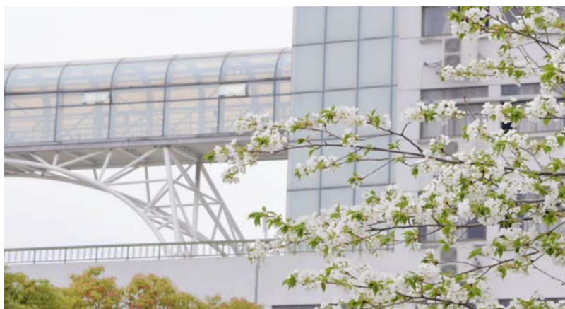
明德花开