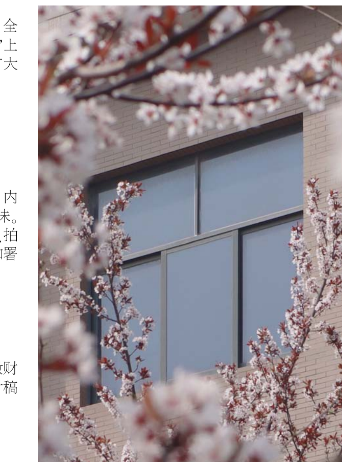
校园一角