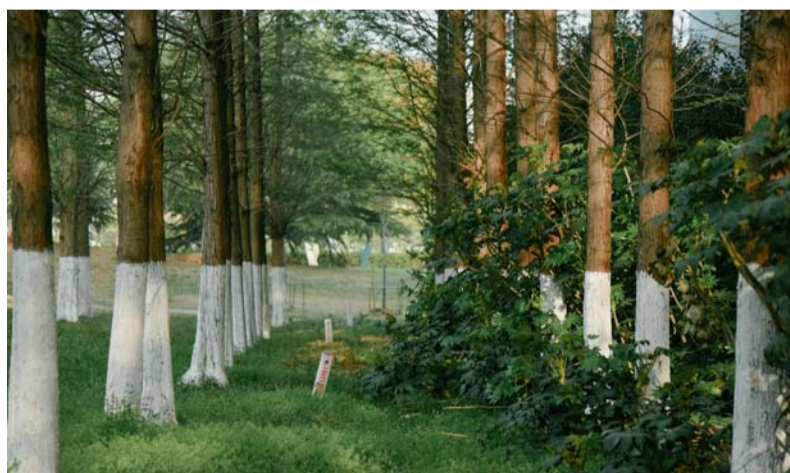
校园一角