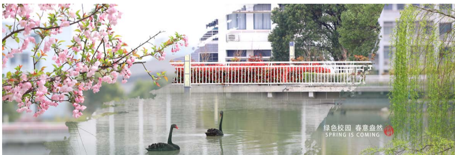
绿色校园 春意盎然