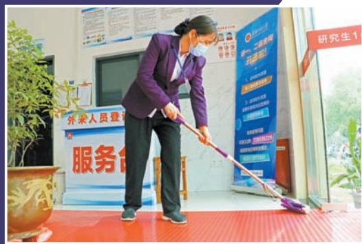
宿管阿姨定期消杀宿舍，让学生安心生活。