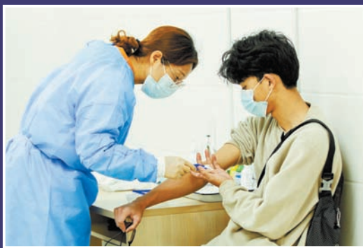
校医院医护人员假期值班，守护师生健康。