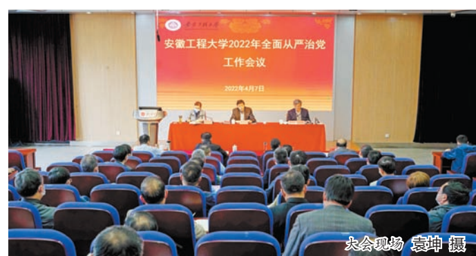
大会现场