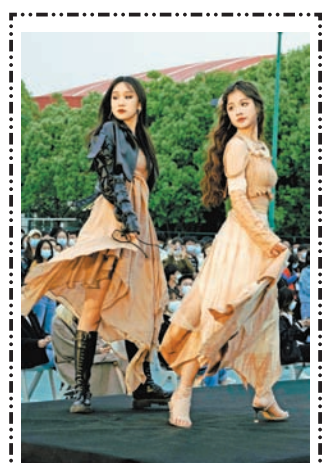
2022年4月30日，纺织服装学院在风雨篮球场举办“星程华辉”春夏时装周发布秀。