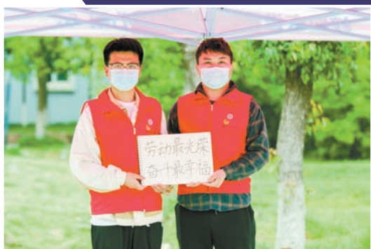
“党员突击队”奋战一线，全心全意为师生服务。