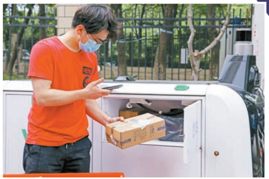
快递小哥放弃假期休息，确保快递按时到达。