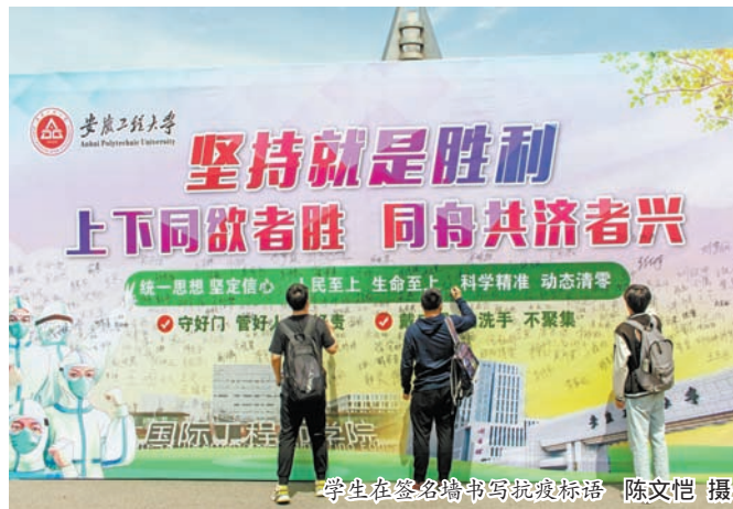
学生在签名墙书写抗疫标语