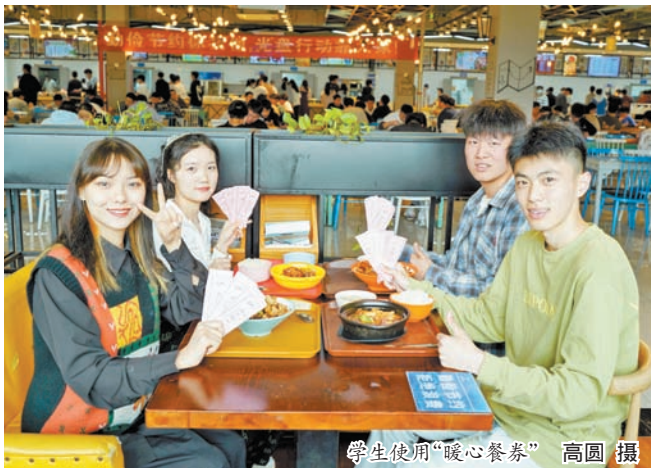
学生使用“暖心餐券”