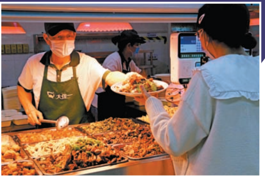
食堂大叔热情地招呼着，让学生感受“家的味道”。