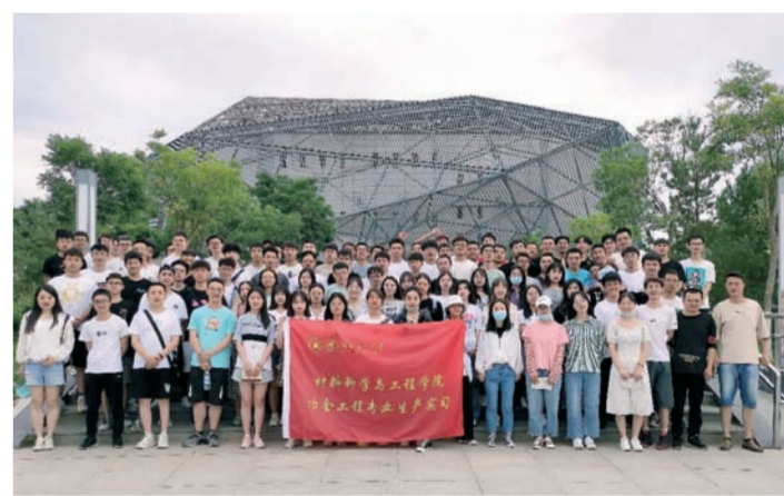
大三我们专业去生产实习

16 号楼的 302 宿舍，当这扇门再度被推开，又会是哪六个人的青春？兰工坪路 287 号以及彭家坪路 36 号，当军训的哨音再度吹起时，又会是哪一届学生的芳华？