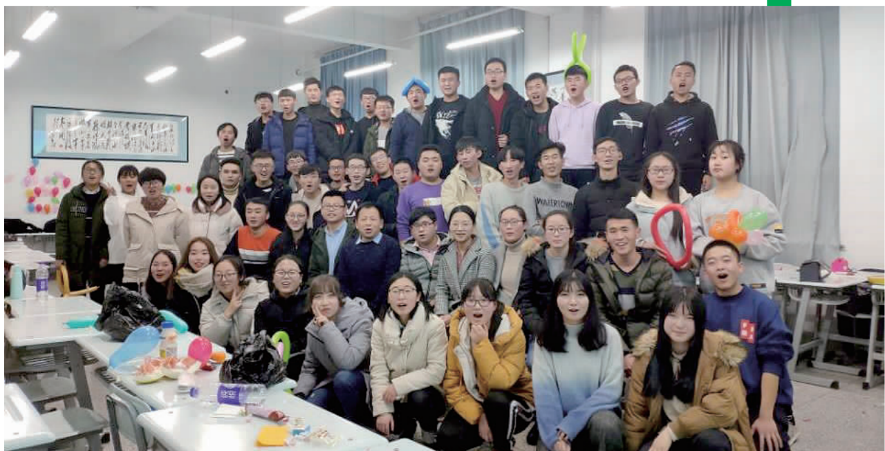
大一时班内组织的元旦晚会