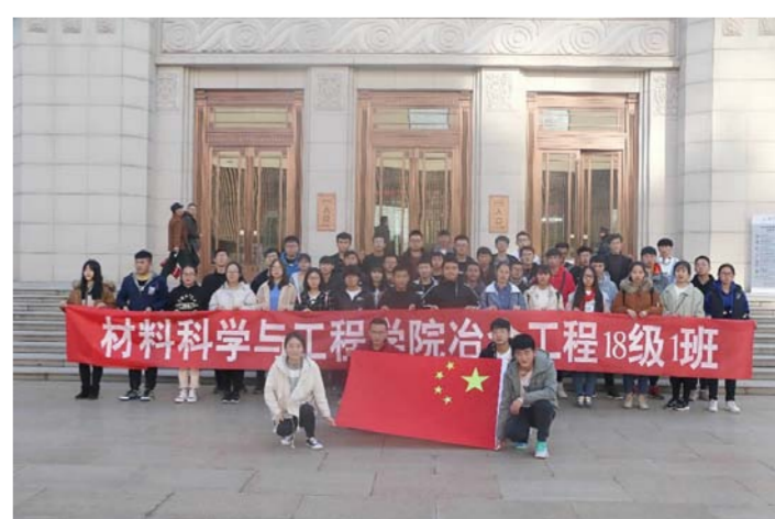
第一次团日活动，我们去了甘肃省博物馆